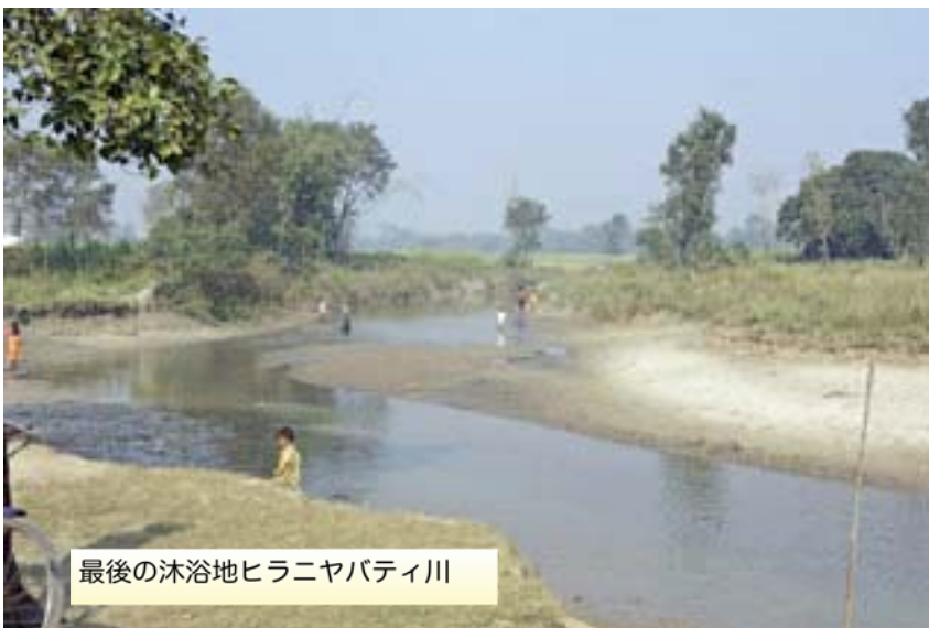
最後の沐浴地ヒラニヤパティ川

インド南部の州の仏教徒（ネオ・ブディストと呼ばれ、元は最下層のカーストの人達だそうですが）がいっぱいで、それぞれの国の力がついてきたことが良く分かりました。そして、皆さんとても熱心に長い時間お祈りを捧げていました。 この時期のインドは渇水期で、どこの川も水が少なく濁っていますが、最後に沐浴されたヒラニヤパティ川だけは、日本のような清流でホッとしました。 ここから涅槃堂までは約一キロ。お釈迦さまの心に少しでも触れたいと、この道を含んで歩きました。 最後のお姿を刻んだ涅槃像は長さ六メートル。安置する涅槃堂はビルマの仏教徒が造ったものらしく、様式がインド風ではありませんね。 クシナガールのホテルで夕食後、永年の夢だったお釈迦さまの最後のお言葉、『遺教経』を節付きで読みました。長いお経なので少し端折りましたが、それでも夢を叶えることが出来ました。