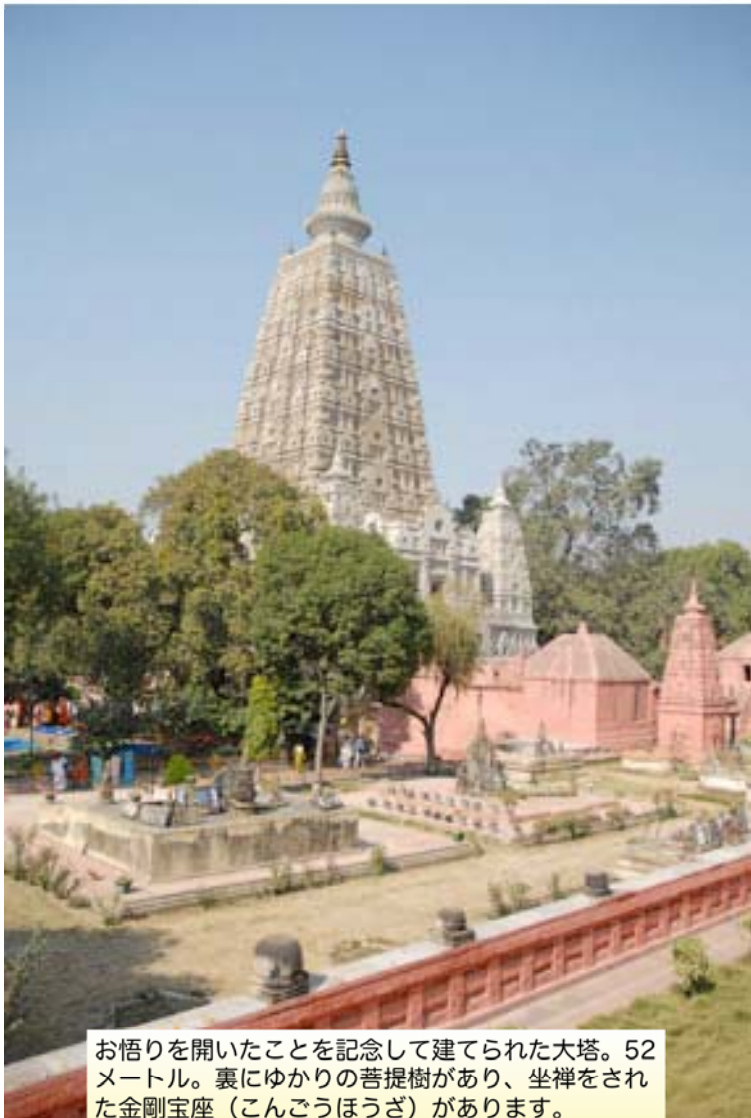
お悟りを開いたことを記念して建てられた大塔。52メートル。裏にゆかりの菩提樹があり、坐禅をされた金剛宝座(こんごうほうざ)があります。

ご存知のように、日本には酷寒のヒマラヤを越え灼熱の砂漠のオアシス国家を越えて、中国・朝鮮経由でた