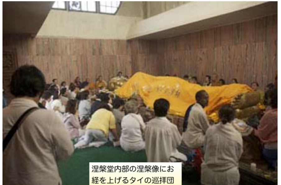
涅槃堂内部の涅槃像にお経を上げるタイの巡拝団

パリニツバーナ・スッタタ（大般涅槃經）というパリ語のお経があります。このお経に記された遊行の出発地ラジギルから、お涅槃のクシナガールに到る道を通り、お釈迦さまのお心に触れたいと、東京の旅行社フランニング・ワールドさんをお願いして、コース作りをして戴きました。