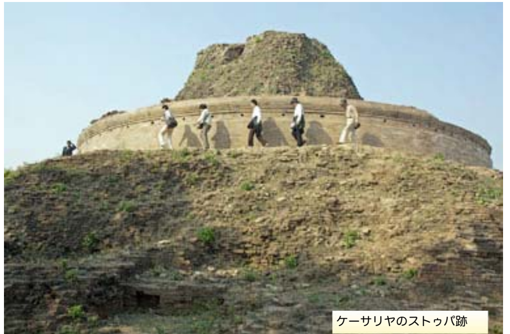
ケーサリヤのストゥパ跡

どり着きました。それから千五百年、この国の人々の心の糧となつて今に伝えられています。